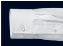
Verstellbare Manschette mit Kombi-Funktion (zwei Knöpfe zur Weitenregulierung, zwei Knopflöcher für Manschettenknöpfe) Adjustable cuff with combi function (two buttons to adjust width, two buttonholes for cuff links) Poignet réglable (deux boutons pour régler la taille du poignet, deux boutonnières pour les boutons de manchette)