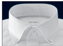
Button-Down Button-down Pointées boutonnées