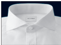
Haifisch Cutaway Italien