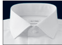
Global Kent Global Kent Global Kent