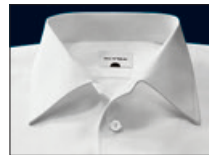
Elbe Elbe Elbe