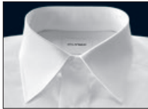
Kent Kent Kent