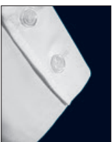
3-fach Absteppung 3-fold top-stitching Triple pique