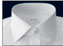
New York Kent New York Kent New York Kent