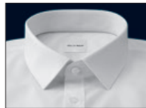
Urban Kent Urban Kent Urban Kent