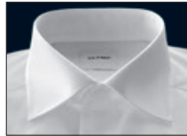
New Kent New Kent Nouveau Kent