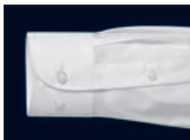
Verstellbare Manschette (zwei Knöpfe zur Weitenregulierung) Adjustable cuff (two buttons to adjust width) Poignet réglable (deux boutons pour régler la taille du poignet)