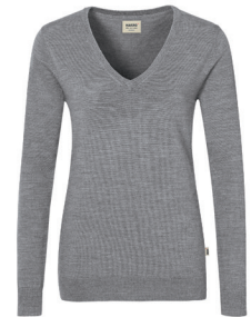
315 dunkelgrau meliert